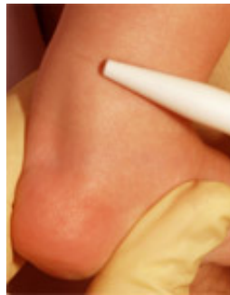
Kleine Narbe (3mm) nach der Operation