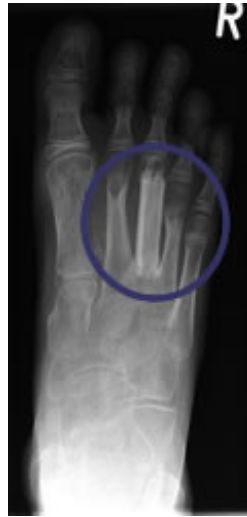
Rekonstruktion mit Wadenbeintransplantat