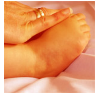
Ergebnis bei Fußstreckung

Im Bereich der speziellen Kinderorthopädie werden neuroorthopädische Krankheitsbilder wie die infantile Cerebralparese, die Spina bifida, die Muskeldystrophie u.a. in enger Zusammenarbeit mit der Neuropädiatrie der Kinderklinik versorgt