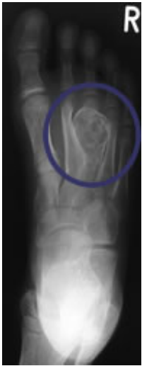
Riesenzelltumor im Mittelfußknochen