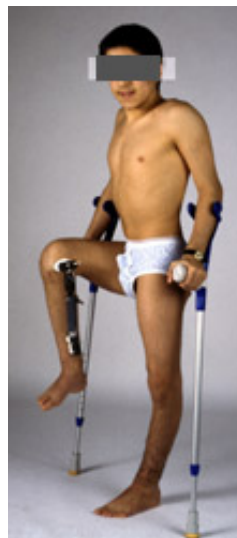
während der Korrektur mit einem Fixateur externe externe