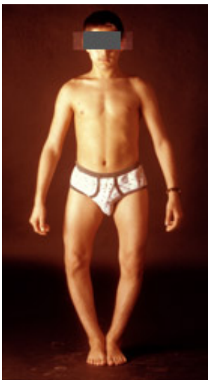
O-Beinfehlstellung vor der Operation

Die Behandlung von Fehlbildungen und Fehlstellungen sowie Achsabweichung, Beinlängendifferenzen und Rotationsfehlern stellt einen besonderen Schwerpunkt dar.