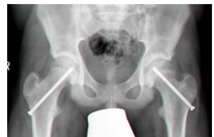
Nach perkutaner Verschraubung (ca. 1cm langer Hautschnitt)

In Kooperation mit der Kinderonkologie können alle Tumorerkrankungen des Bewegungsapparates von der Probeentnahme über die definitive Operation der Knochen- und Weichteiltumore bis zu umfangreichen Hilfsmittelerstellung und -versorgung therapiert werden.