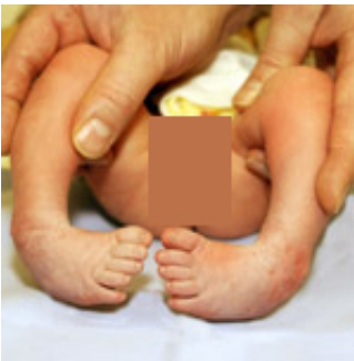
Klumpfüße beidseits bei einem 3 Tage alten Neugeborenen

In der allgemeinen Kinderorthopädie werden die kindlichen Fußdeformitäten wie Klumpfuß, Sichelfuß, Plattfuß, Hackenfuß und Hohlfuß, die Erkrankungen des Hüftgelenkes, wie Hüftkopfabrutsch, der Morbus Perthes, die Hüftdysplasie und -luxation, die entzündlichen Hüftgelenkserkrankungen, der Schiefhals und die Osteochondrosis dissecans behandelt