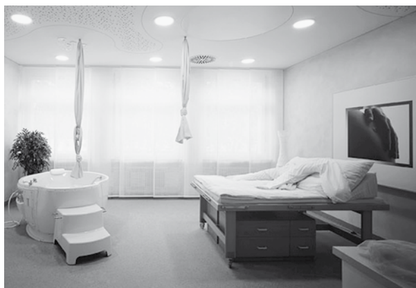
Einer der Kreißsäle

Lernen Sie uns und unsere neuen Räumlichkeiten kennen! Wir freuen uns auf Sie!