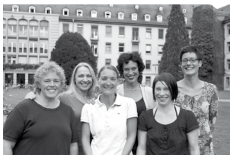
Einige unserer Hebammen