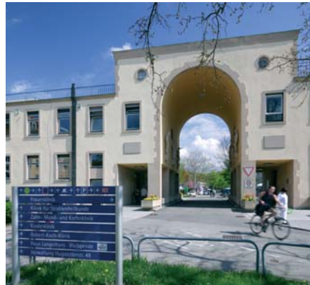
Universitätsklinikum – Torbogen