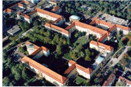
Universitätsklinikum – Lorenzring