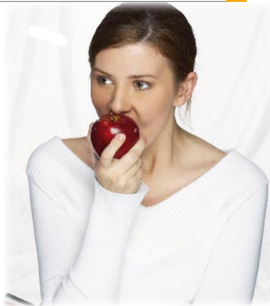
Der erste Apfel nach dem Fasten – ein ganz besonderer Genuss.

ausscheidung und als schweisstreibendes Mittel bei Erkältungskrankheiten genutzt: Tee aus 10 g reifen getrockneten Holunderbeeren mit kaltem Wasser ansetzen, mehrere Minuten stehen lassen und dann langsam zum Sieden erhitzen, kurz aufkochen, 5 bis 10 min stehen lassen und abseihen, davon mehrmals täglich eine Tasse trinken. Oder Holunderblütentee (3 bis 4 g = 2 Teelöffel pro 150 ml als Aufguss, Tagesdosis 10 bis 15 g).