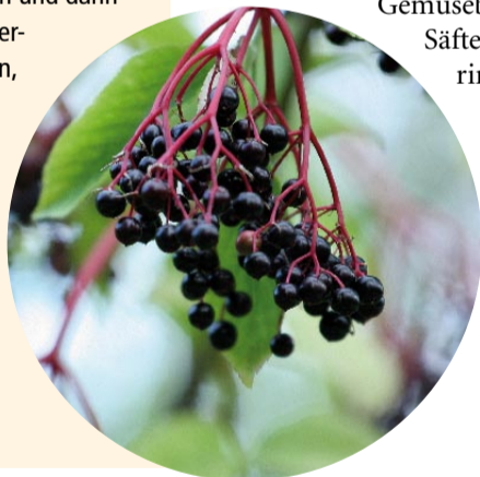
Die Beeren des schwarzen Holunders sollten Sie nicht roh geniessen.