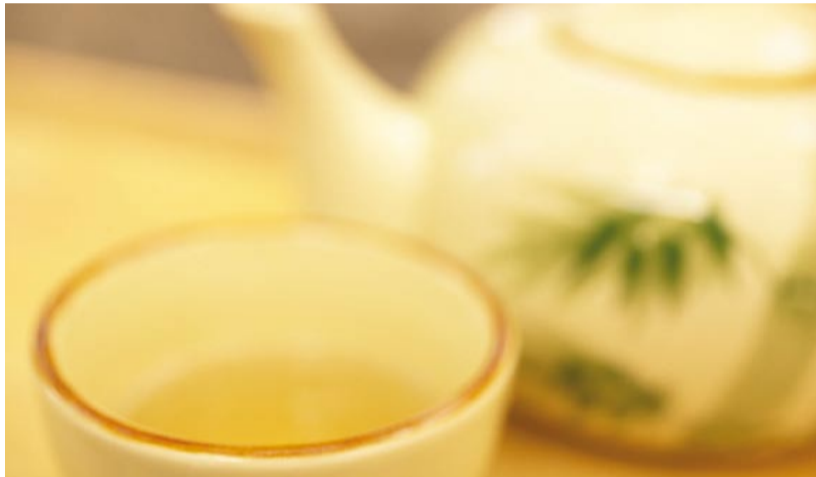
Beim Fasten ist es wichtig, ausreichend zu trinken. Je nach Art des Fastens können das Wasser, Saft, Molke, spezielle Eiweisszubereitungen oder Tee sein.