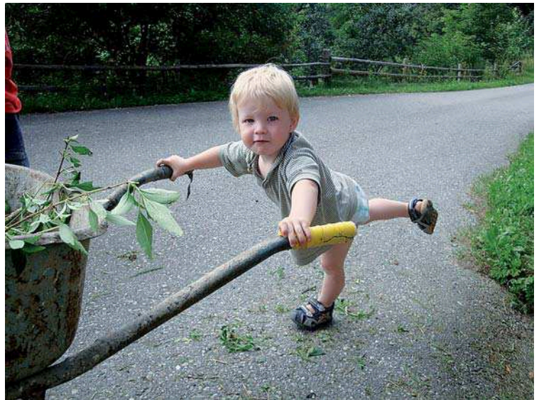
Abb. 3 „Smile of Mastery“: „Ich kann das!“

Aus dieser Position heraus machen Kinder zu Beginn des 4. Lebensjahrs eine völlig neue Erfahrung: Sie sehen sich nicht nur mit der Mama oder mit dem Papa, sondern sehen die Mama mit dem Papa und erleben sich selbst als „Dritte“. Diese Erfahrung bildet nicht nur eine wichtige Voraussetzung für die geistige Dezentrierung,