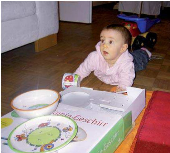
Abb. 4 Triangulärer Blick: „Was meinst du zu dieser neuen Tasse?“

Im Alter zwischen 12 und 18 Monaten bildet der trianguläre Blick die zentrale Form des kommunikativen Austauschs; bei jedem kleinen Ereignis „fragt“ das Kind auf diese Weise, was wir dazu sagen, und lernt so die Wörter mit den Gegenständen und Handlungen zu verknüpfen.