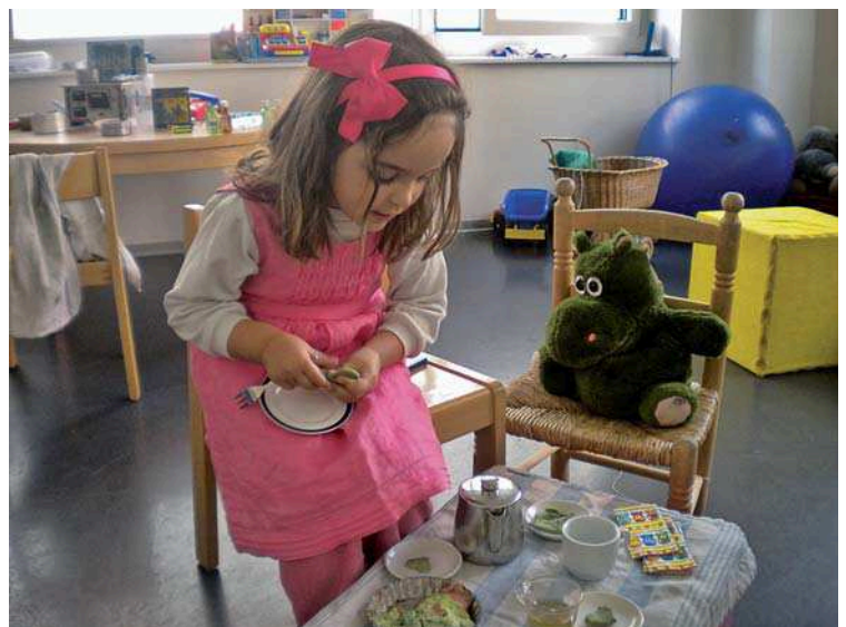
Abb. 6 Spielend abklären.

Eine Untersuchung der Sprache muss darauf ausgerichtet sein, die repräsentativen und kommunikativen Fähigkeiten des Kindes zu erfassen. Im Kleinkindes- und Vorschulalter eignet sich dazu am besten eine Kochsituation (Abb. 6). In erster Linie ist diese hochgradig kulturunabhängig, d. h. Kindern aus allen Kulturkreisen vertraut. Gleichzeitig ist damit die Chance