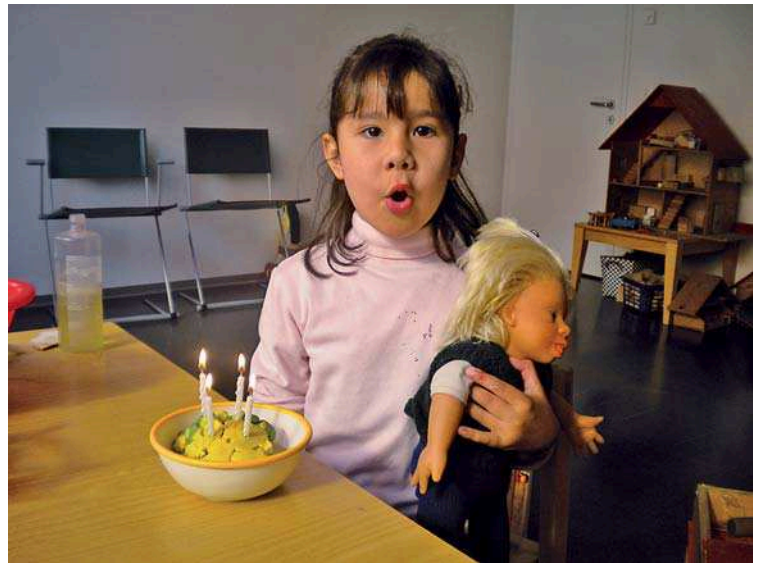
Abb. 8 Symbolspiel als Grundlage für den sprachlichen Austausch.

Häusermann [25] schreibt dazu: „Sprachförderung für all jene Kinder zu fordern, deren Sprachstand ungenügend ist, ohne zu unterscheiden, ob sie diese wirklich nötig haben, vernachlässigt die Tatsache, dass Kinder Sprache auch ohne spezifische Förderung lernen können. Wird eine einzelne Zielgruppe für die Sprachförderung definiert, besteht die Gefahr, dass mehrsprachig sein – oder aus einem sozioökonomisch tiefen Milieu sein – pauschal mit „sprachauffällig sein“ gleichgesetzt wird. Dies widerspricht jedoch der Tatsache, dass