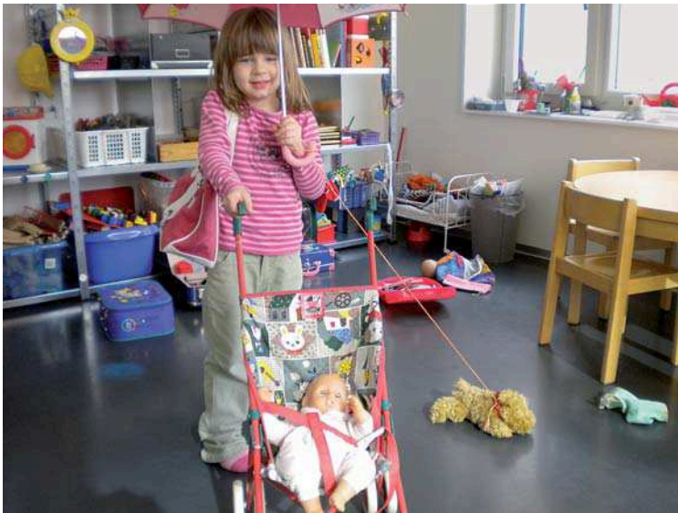
Abb. 1 Geplantes Symbolspiel: einkaufen gehen.

interessant, mit dem Malstift auf dem Papier hin- und herzufahren, sondern das Kind entdeckt, dass dadurch etwas entstanden ist. Oder es legt nicht mehr nur wahlweise Klötze neben- und aufeinander, sondern es sieht, dass es auch etwas bauen kann.