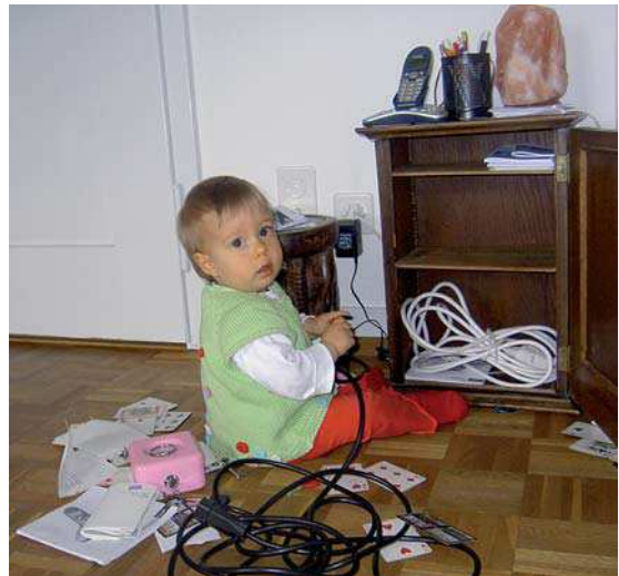
Abb. 2 Erste Konflikte sind vorprogrammiert.

Etwa ab dem 3. Geburtstag können sich Kinder dann nicht mehr nur einzelne Dinge oder Personen vorstellen, sondern ganze Szenen oder Ereignisse. Entsprechend wird das Spielthema nun im Vorhinein festgelegt, die passenden Spielgegenstände zusammengesucht und der Spielablauf gemäß den eigenen Wünschen geplant (Abb. 1). Die Fähigkeit, Vorstellung-