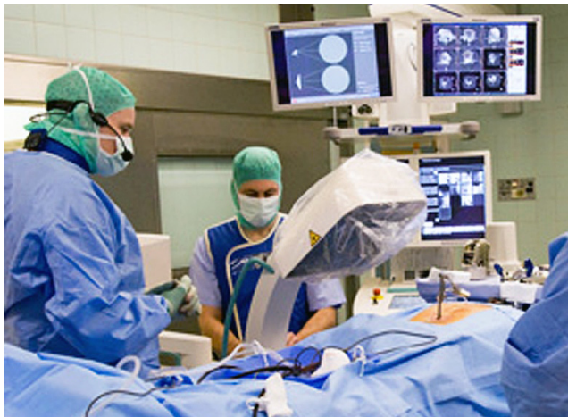
Der Neurochirurg positioniert mit Hilfe hochmoderner, 3D-gesteuerter Bildgebung mit Navigation die Schrauben für eine Wirbelsäulenstabilisierung.

Erkrankungen an der Wirbelsäule stellen die häufigste Ursache für einen neurochirurgischen Eingriff dar. In unserer Klinik erfolgt ein derartiger Eingriff möglichst schonend unter Verwendung minimal invasiver Zugangstechniken.