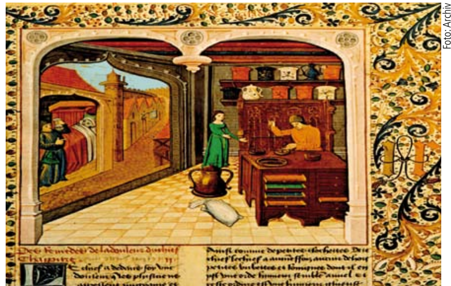
In jedem Kloster wurden ausgewählte Mönche mit der Funktion «Klosterarzt» oder «Klosterapotheker» betraut.

Krankheiten»). Im letzten Jahrhundert erlebte die sog. «Hildegardmedizin» als Alternative zur modernen Medizin eine Renaissance (Kasten B und C).