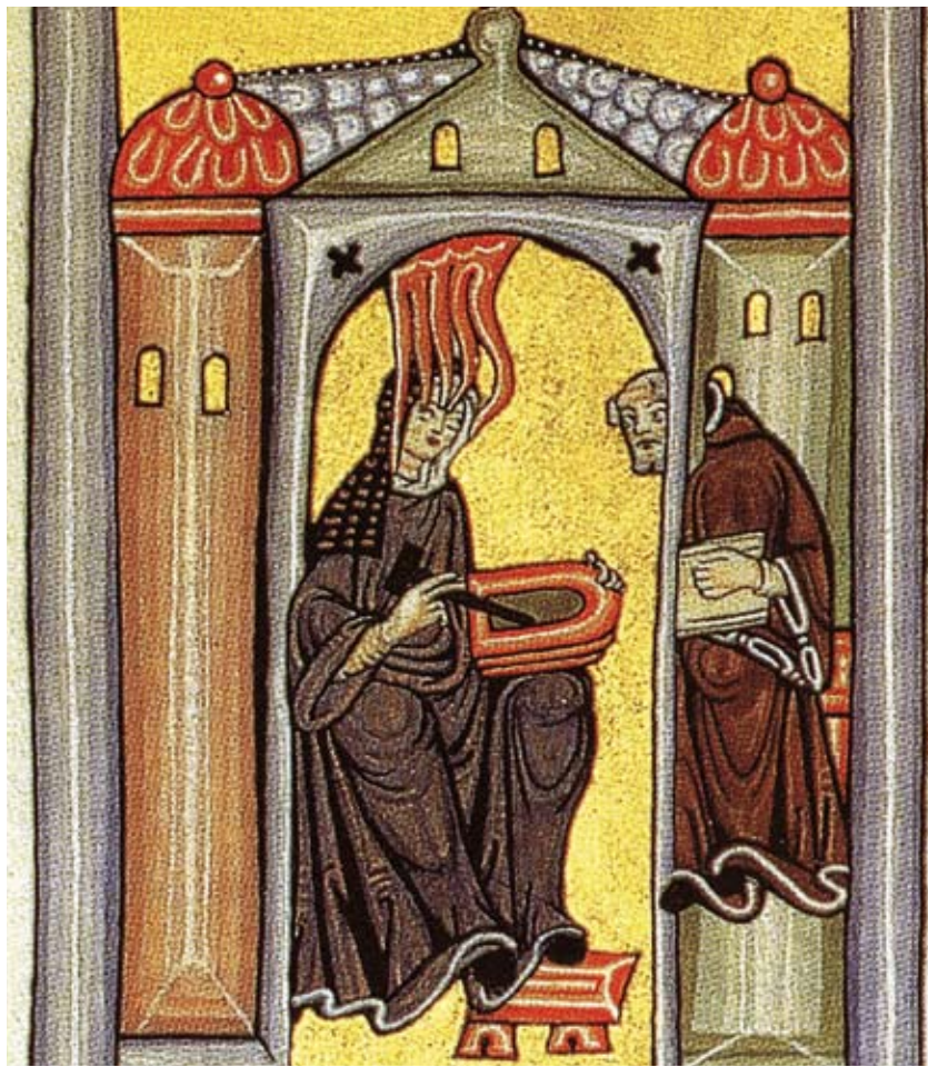
Um die Wirksamkeit der Heilkräuter zu erhöhen und sie haltbarer zu machen, wurden u.a. Wein, Essig, Öl oder Honig zugesetzt.

In Kasten E ist der Einsatz der Pflanzen bei verschiedenen Indikationen zusammen gefasst und Kasten F listet die nachgewiesenen Wirkungen der Pflanzenteile auf.