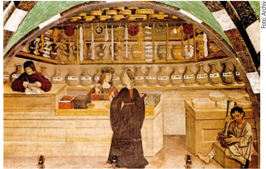
Über Jahrhunderte sammelten Mönche umfangreiches Wissen über die Zubereitung und Anwendung von Heilpflanzen.

Nach den Konzilien im 12. und 13. Jahrhundert wurde den Mönchsärzten von der Kirche die ärztliche Tätigkeit untersagt. Der Infirmarius durfte sich nur noch um die Pflege der erkrankten Brüder kümmern. Die Behandlung bestand aus Bettruhe, besonderer Verpflegung, Aderlass und dem Verabreichen pflanzlicher Arzneimittel.