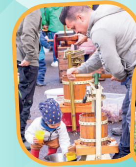
FAMILIENAKTION SCHULBAUERNHOF EMMENDINGEN